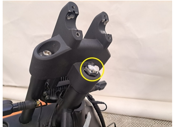
Irrota ohjauslaakereiden mutteri. (kiintoavain 30 mm).