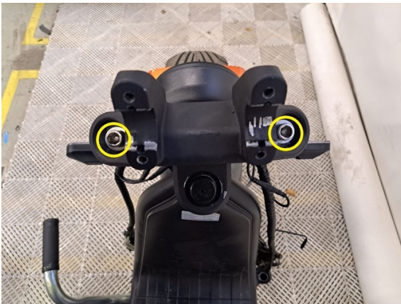
Irrota pultit. (kuusiokoloavain 10 mm).