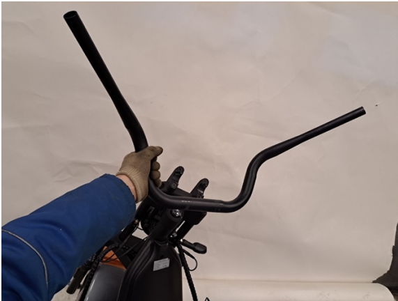
Ota ohjaustanko pois.