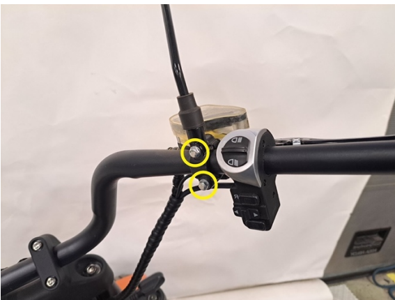
Irrota vasemmanpuoleisen jarrupääsylinterin kaksi kiinnityspulttia. (kuusiokoloavain 8 mm).