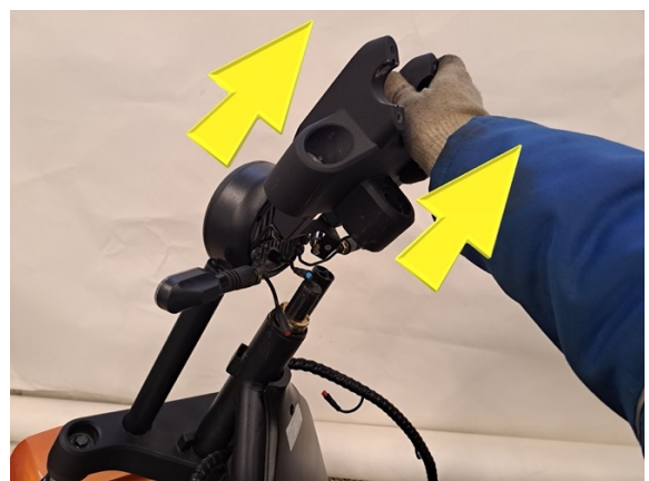
Nosta etuhaarukan ylä T-pala / ohjaustangon pidike pois.