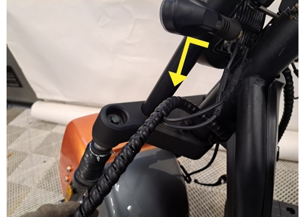
Vedä johdot vapaaksi kummaltakin puolelta.