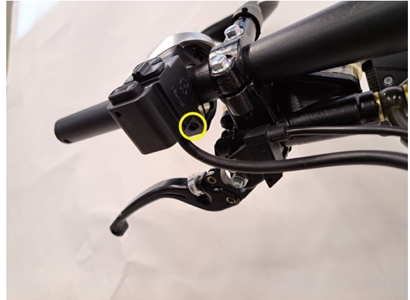
Löysää vasemman kahvarungon ruuvi. (kuusiokoloavain 3 mm).