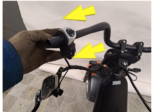
Ota vasen kahva pois.